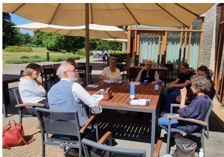
Reflecties over de kloosterregel Bid en Bemin tijdens de participantendag.

Kloosterregel van Getijdengemeenschap De Binnenkamer