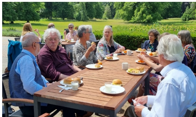
Impressie van de participantendag van vorig jaar