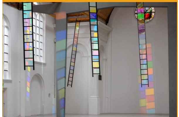
Foto: ‘Stairway to heaven’ was een installatie in de Elleboogkerk in Amersfoort